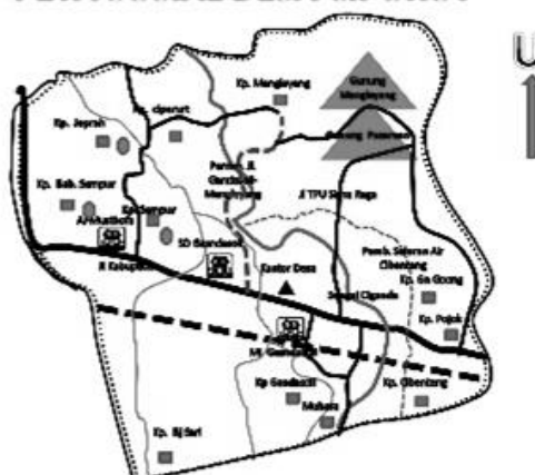
PETA SOSIAL DESA CIPURUT

Secara geografis luas desa Cipurut yaitu 292,172 Ha dengan batas wilayah sebelah utara berbatasan dengan desa Tegal Panjang, Sebelah timur berbatasan dengan desa Cireunghas, sebelah selatan berbatasan dengan desa Buniwangi, dan sebelah barat berbatasan dengan desa Selawangi. Iklim di desa Cipurut sama dengan beberapa tempat lainnya pada elevasi yang sama yakni cenderung lembab dan hangat dengan jumlah curah hujan rata-rata 22.00 mm/tahun dengan jumlah bulan hujan rata-rata 6 bulan/tahun sementara suhu rata-rata harian siang hari mencapai 28°C dan malam hari mencapai 18°C, dengan elevasi 530 m dari permukaan laut.